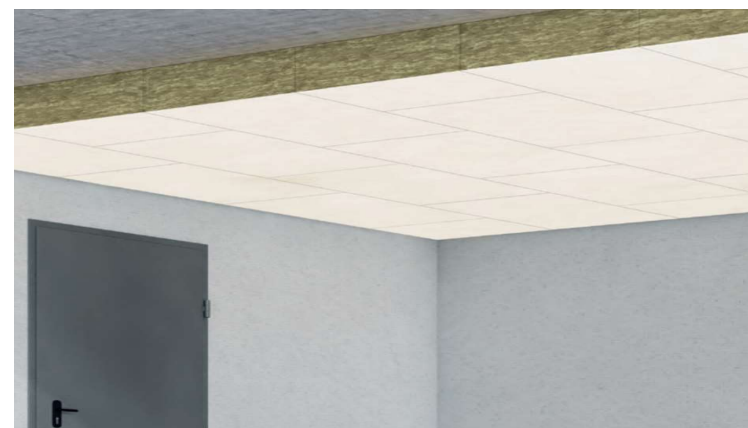
Beispielhafte Anwendung der URSA TECTONIC UPh/Vv & UPh/Vv/Vk Deckendämmplatte: Klebmontage an der Kellerdecke

**Auf Anfrage auch mit folgenden Beschichtungen erhältlich (einseitig/beidseitig/Kombinationen möglich: schwarzes Glasvlies (Vr), gelbes Glasvlies (Vk), schwarzes Glasgewebe (Ge), gitterverstärkte Aluminiumfolie (Ah)