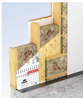
Beispielhafte Anwendungen der URSA TECTONIC UPh Universaldämmplatte: Holzriegelkonstruktion